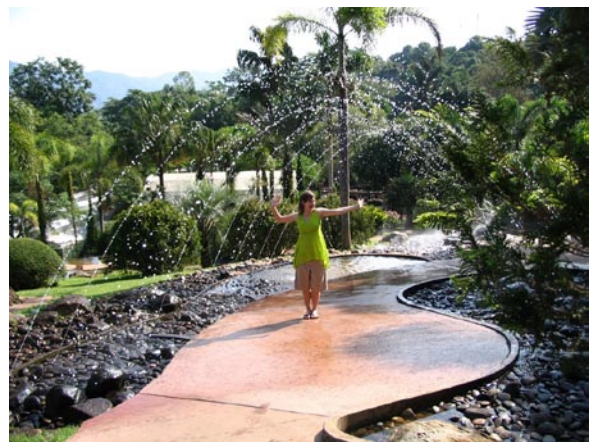
Wasserspiele im Luang Garten

Jedenfalls kommen wir wie immer wohlbehalten an unserem Ziel an. Der erste Punkt auf unserem Programm heute ist der Luang Garten. Eine wundervolle und riesige Gartenanlage! Riesig aber überhaupt nicht wundervoll ist hingegen die Spinne die zwischen zwei Bäumen ihr Netz aufgespannt hat. Natürlich wird das Riesenvieh erstmal fotografiert, aber als wir dann unter der handgroßen Spinne durchgehen sollen, wird mir schon ein wenig anders. Da hilft nur Augen zu und durch. Da wir schon relativ früh an dem Garten sind, haben wir das Gelände fast für uns alleine. Und gerade als wir den Garten verlassen, sehen wir wie 2 Busse mit japanischen Touris ankommen. Da sind wir der Meute noch mal um Haaresbreite entkommen.