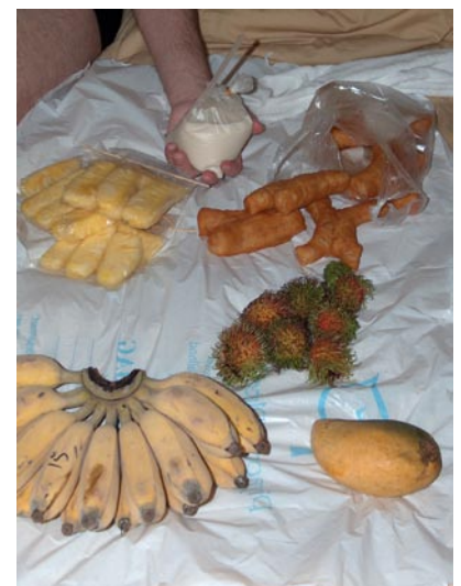
Picknick im Hotel

Wir blicken skeptisch, als der Koch das zubereitet und uns wird spontan so ein Teilchen zum probieren angeboten. So ein Angebot kann man natürlich nicht abschlagen und ich greife zu. Doch schon nach wenigen Sekunden entpuppt sich dieser Entschluss als wenig weise. Die Teigteilchen hätte man vorher wohl lieber ein wenig abkühlen lassen, bevor man sie aus dem heißen Fett in die Hand nimmt. Den Finger habe ich mir da zwar etwas verbrannt aber die Eiswürfel im Hotelzimmer haben schlimmeres verhindert. So können wir uns zu guter letzt 2 Stauden Bananen, ne handvoll Stachel Früchte, Milch im Plastikbeutel, 4 Tüten Ananas und eben diese ominösen Teigteile für den Preis von 65 Baht, also knapp 1,50 Euro, genehmigen. Traumhaft! Und zu unserem Picknick haben wir mit Forest Gump auf Englisch sogar noch ne schöne Unterhaltung für nebenher.