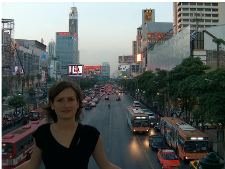
Ein Blick nach links und wir sehen das WTC von Bangkok