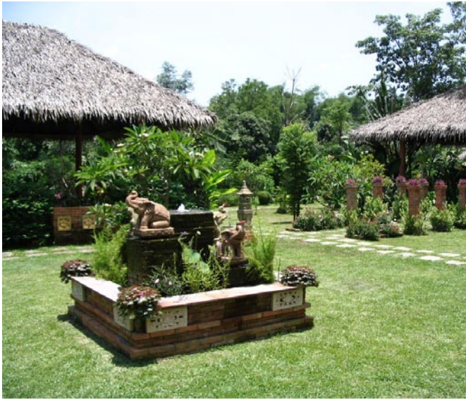
Hier der Garten in dem wir Mittags waren

Hälfte leer sind, bleibt uns nicht viel übrig als die gute alte Handwäsche. Dabei gibt es 2 wichtige Dinge zu lernen.