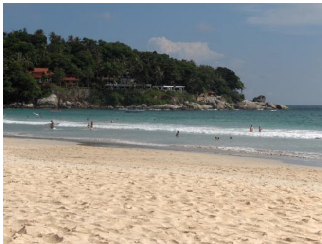
Unser Strand am Kata Beach

Am Abend dann schon traditionell ab ins Kata Mama zum essen.