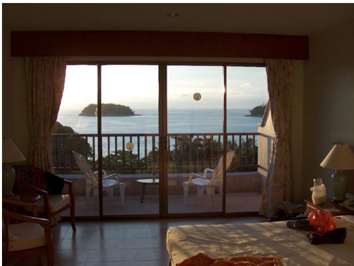
Unser Hotelzimmer in Phuket

Von unserem Zimmer aus haben wir den perfekten Blick aufs Meer um den Sonnenuntergang zu beobachten. Langsam senkt sich die Sonne, verfärbt sich immer mehr ins rötliche und versinkt dann im Meer. Es wird Dunkel. Und genau zu diesem Zeitpunkt als die Sonne verschwindet, macht sich in der gesamten Nachbarschaft der komplette Insektenstaat zu einem Konzert auf. Von einem Moment auf dem anderen weicht die ansonsten so idyllische Ruhe den engagiert aufspielenden Insekten. Ein Ritual, das sich jeden Abend wiederholt und für 10-20 Minuten anhält.