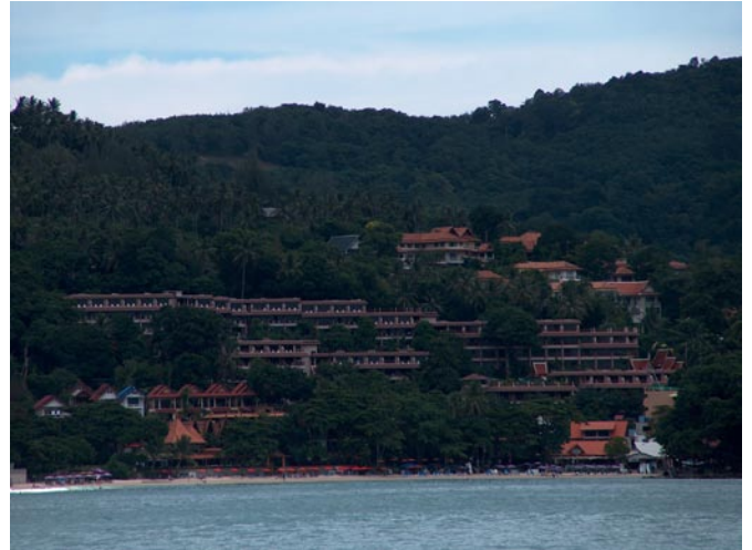
Ein letzter Blick auf unser Hotel

Nach einer Stunden Kneten, drücken und massieren tut es überall weh. Es melden sich Muskeln zu Wort von denen man ursprünglich gar nicht wusste, dass man sie hat. Und irgendwie weiß man nicht so ganz ob es nun Schmerzen sind oder doch eher Glücksgefühle die einen überkommen. Jedenfalls sind wir ganz schön platt und mitgenommen, aber wir haben es wenigstens mal gemacht. Im Hotelzimmer angekommen ist die letzte Aufgabe für morgen zu packen, denn wir müssen früh los.