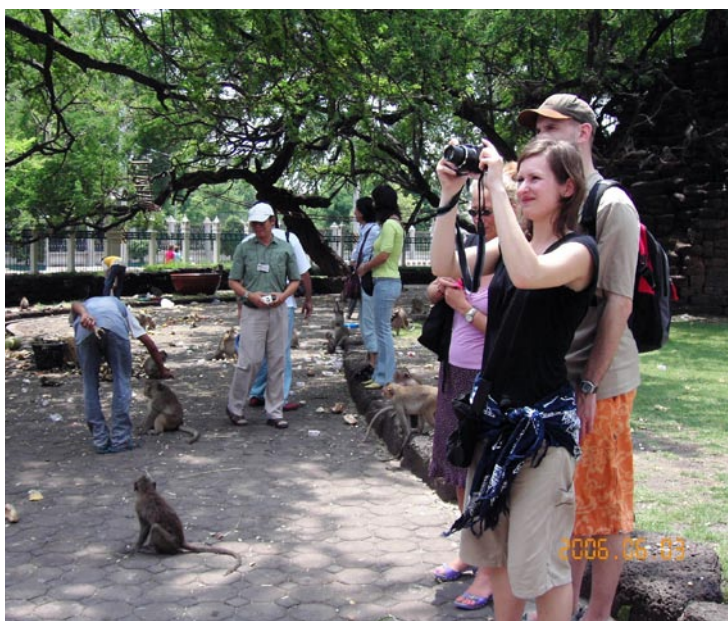
Die Affen von Lopburi....ähm linke Bilbhälfte natürlich ;-)

Weiter geht es Richtung Lopburi. Dort besichtigen wir in der Stadtmitte eine Pagoda die von vielen Affen als Wohnort benutzt wird. Mitten in der Stadt wohlgermerkt.