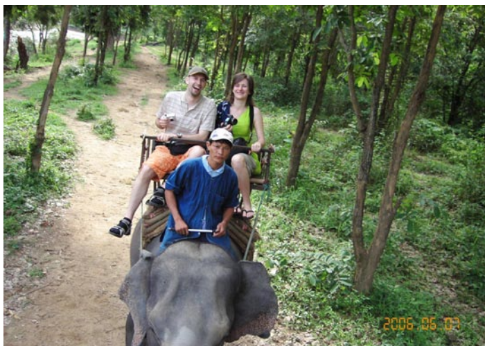
Der Ritt auf dem Elefanten

Mittagessen gibt es dieses Mal auf einer Orchideenfarm wo sich unter anderem handgroße Schmetterlinge rumtreiben. Und wenn ich da an die Spinne im Luang Garten von gestern denke und das mit den Schmetterlingen hier vergleiche, dann muss ich sagen, dass hier die Größenverhältnisse und Proportionen wenigstens wieder stimmen.