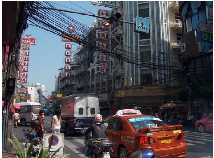
Irgendwo in Bangkok

Und noch bevor es dunkel wird erreichen wir das große Einkaufszentrum und beginnen voller Vorfreude auf eine neue Garderobe mit dem Shopping. Wobei am ersten kleinen Laden ist nicht wirklich was für uns dabei. Im zweiten auch nicht. Aber kein Problem, sind ja über 100 so kleine Geschäftchen. Im dritten Laden hab ich dann endlich was gesehen, das mir ganz gut gefällt. Eine Short. Doch wo anprobieren in dem 9 Quadratmeter kleinen Shop? Es ist zwar günstig hier, aber unprobiert was kaufen ist dann auch nicht so meins. Und für meinen