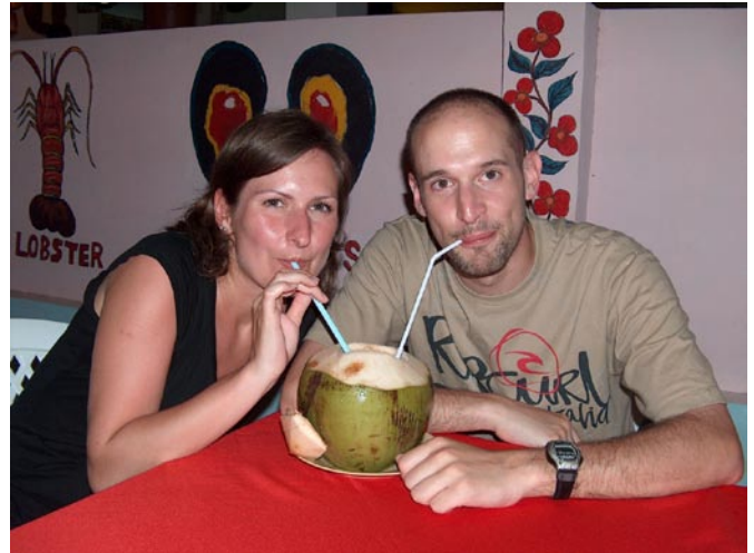
Allabendliches Geschlürfe im Kata Mama