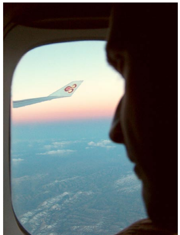
Über den Wolken

Mittlerweile ist es 21.10 Uhr und es heißt ab in den Flieger. Über 10 Stunden Flug von München nach Bangkok. Und im Flugzeug dann schon die erste Erkenntnis: Die Sonne geht nur auf einer Seite des Flugzeugs auf. Klingt komisch, ist aber so. Während die Leute auf der linken Seite einen farbenfrohen Sonnenaufgang genießen, müssen wir auf der rechten Seite in die dunkle Seite des Himmels blicken.