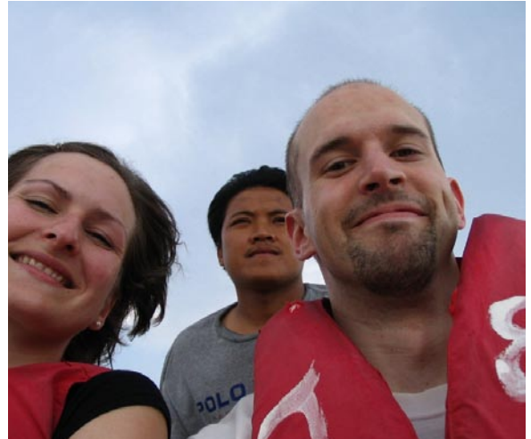
Unterwegs auf dem Mekong Richtung Laos

Wir jedenfalls brauchen diesen Stempel nicht. Kommen aber in den Genuss mit 70 Sachen über den Mekong zu rauschen und auf einer abseits gelegenen Insel doch laotischen Boden zu betreten. Das Goldene Dreieck ist, oder besser gesagt war, bekannt für den Opiumhandel, der heute natürlich strengstens verboten ist. So wird auch die „Ausreise“ aus dem Goldenen Dreieck wie am Zoll überwacht. Als uns die Polizei nicht gleich weiterfahren lässt, dreht sich Patt zu uns um und meint mit ernster Miene: „Ok, wer hat verräterisches Gesicht gemacht?“ Aber alles kein Problem und es geht ab nach Mae Sai, wo auch unser Hotel Piyaporn Palace nur wenige Meter an der Grenze zu Burma/Myanmar ist.