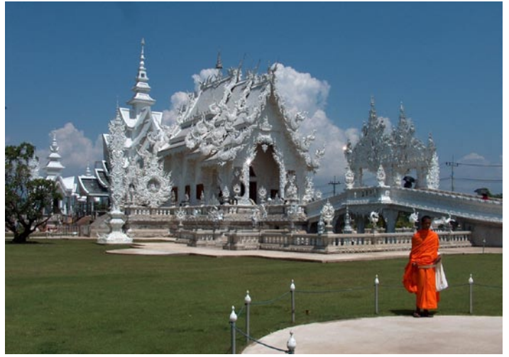
Der Glastempel in Chiang Mai

Und wahrlich der Nachtmarkt ist sehr groß und sehr unübersichtlich. In jeder Gasse sind Geschäfte und es scheint keinen richtigen Anfang noch Ende zu geben. Wir essen noch was auf dem Markt, fahren dann mit einem Tuk Tuk mit ca. 80/90 Stundenkilometer wieder zurück zum Hotel, waschen noch mal Wäsche, so wie fast jeden Abend, und fallen dann erschöpft ins Bett. Morgen früh geht es zur Elefantenbesichtigung.