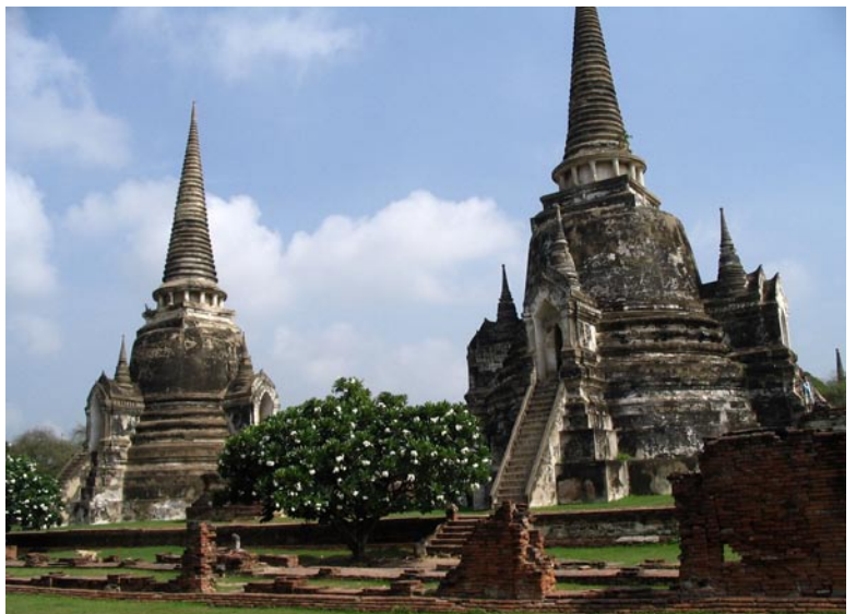
Tempelanlage von Ayutthaya

Doch zurück zur Nordthailand Tour. Der erste Ort unserer Besichtigung ist eine alte Tempelanlage in Ayutthaya. Welche Tempelanlage von welchem König in welchem Jahrhundert in welchem Baustil angefertigt wurde, ich weiß es ehrlich gesagt nicht mehr. Von den Fakten bleiben auf der Rundreise eh nur einzelne Bruchstücke hängen. Auch von den vielen Ritualen und Geschichten, wann die Burmesen warum schon wieder Thailand überfallen haben, hat man sich die wenigstens merken können. Was sich aber scheinbar auf ewig eingebraunt hat sind die Bilder dieser gigantischen Anlagen und Bauten und auch die große Liebe zum Detail die sich bis in den kleinen Teilen der Gebäude wiederfindet.