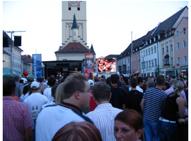
Das 2. Gruppenspiel der deutschen gegen Polen am Stadtplatz von Deggendorf.