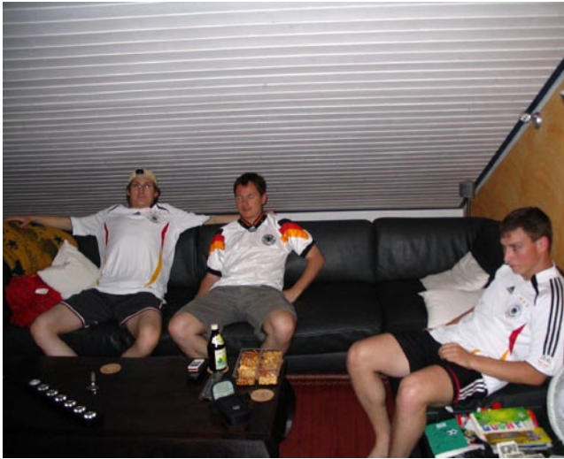
Was liegt näher als auch mal Fußball mit den Leuten zu gucken, mit denen man sonst Fußball spielt?