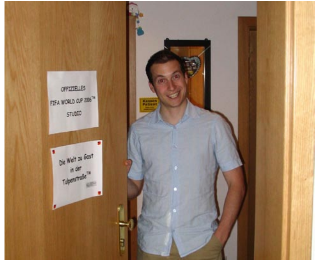
Aber zur richtigen Fußballhochburg wurde das WM-Studio in der Tulpenstraße.

Wer hätte gedacht, dass die Tulpenstraße der Bauchnabel der Fußball-WM werden würde? Mindestens 2 Spiele täglich gab es hier zu bewundern. Was Klopp und Urs fürs ZDF waren, waren Timur und Marion für die Besucher des kleinen WM-Studios.