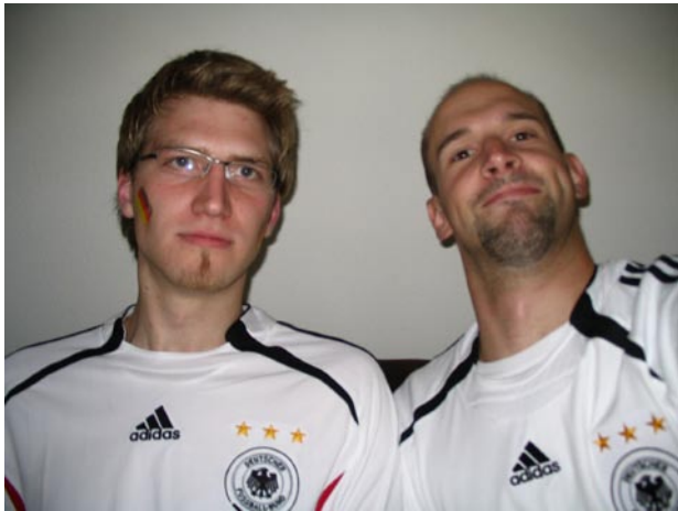
Das Eröffnungsspiel bei Gonzo

Immer dabei: Das Original-„hab-ich-aus-Thailand“-Trikot unserer Jungs und die obligatorische WM-Tasche, mit Kicker-Heft und Stecktafel.